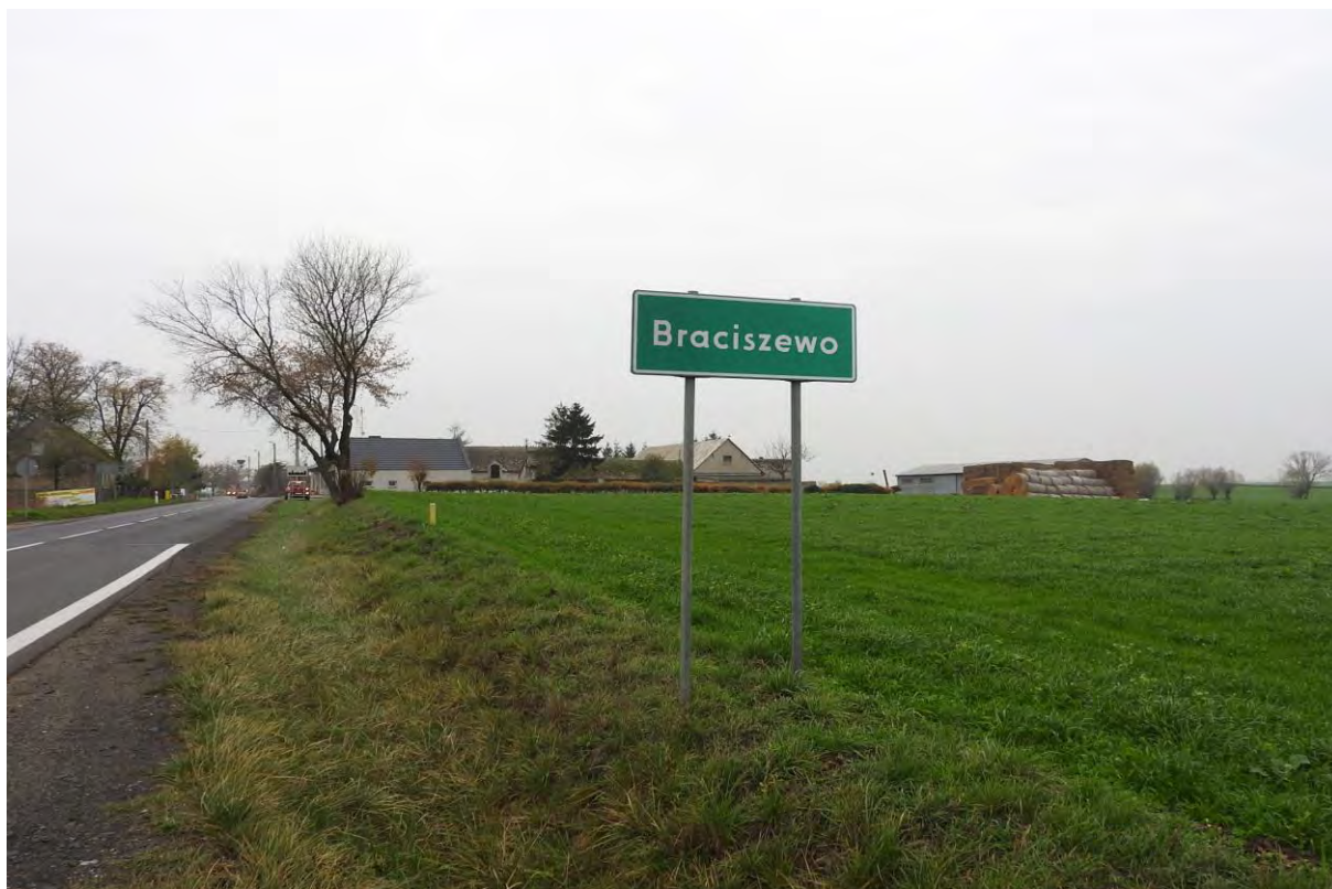
Braciszewo – rolnicza wieś, z widocznymi elementami zabudowy jednorodzinnej