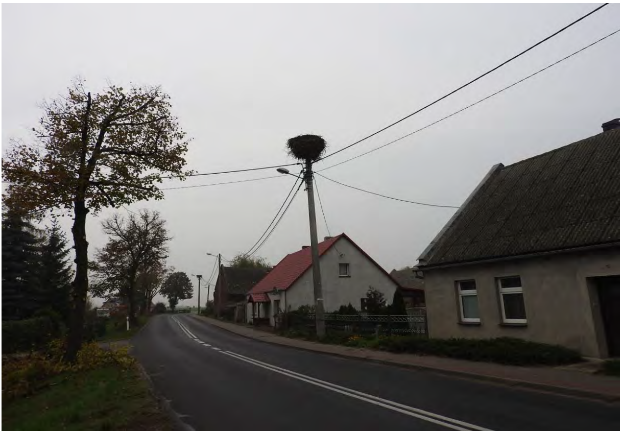
Bocianie gniazda we wsi