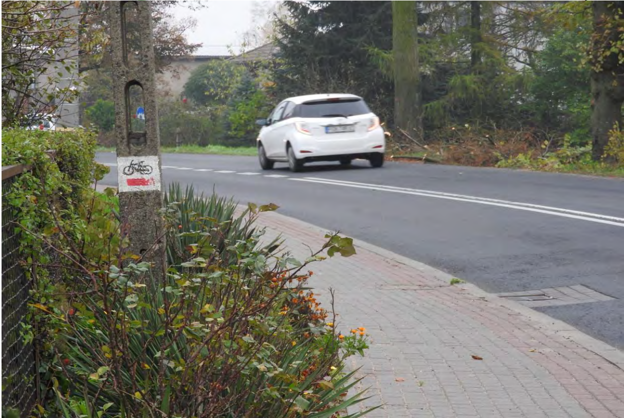
Szlak rowerowy – czerwony