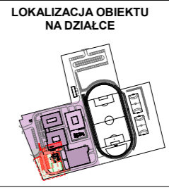
LOKALIZACJA OBIEKTU NA DZIAŁCE

Żłobek w oddzielnej strefie pożarowej: strefa poz. ZL II klasa odporności poż. "C"